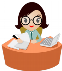
Planilha modelo preenchida

Escolha abaixo, uma das opções para fazer o download.