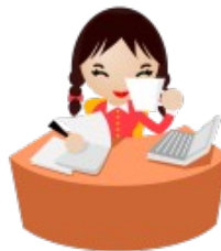
Planilha em branco